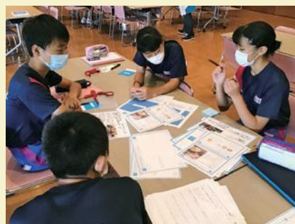
課題をどう解決するか議論する様子

西会津中学校では、社会の一員として必要な「自ら考え行動し問題を解決していける判断力や実行力、自立心」を育てるため、平成15年度から「アントレプレナーシップ(起業家精神)教育」に取り組んできました。情報収集力、分析力、協調性の醸成もねらいとします。これまでは、町教育委員会