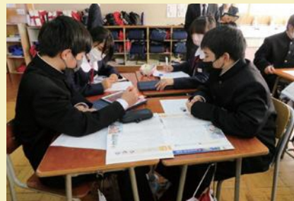
互いの考えを交流しあう生徒

「よい道徳科の授業とは、本音が出し合える授業」印象的だった指導助言のひとつです。追究し続けなければならない命題だと感じています。本研究を通して、教職員一人一人が道徳教育に対する意識を高めることができました。御指導や御協力をいただいた皆様に感謝申し上げますとともに、今後も学校全体で道徳教育に注力してまいります。