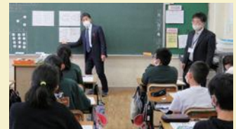
キラリ教科担任制

2年間の実践の成果を、次年度から本格導入となる教科担任制に生かしていきたいと思っています。