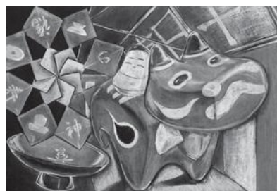
黒板シートでアートコンテスト出品作品

周遊しながら数多くの作品を楽しんでもらえる企画となっている。さらに、昨年度から中学生による黒板アートコンテストを開催した。これは会津学鳳高校美術部の作品が、一昨年度の日学・黒板アート甲子園で全国1位に選ばれたことから企画し、今年度は「黒板シートでアートコンテスト」に形を変え、市内中学校から6校、18チームの参加があった。会津学鳳高校美術部の生徒たちが入賞作品の選考等を行い、先輩が後輩に文化の芽を繋いでいく「新しくて身近な芸術文化」へのチャレンジは、次代を担う子どもたちの感性を大いに高めていくことを強く認識する事業となった。