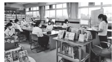
真剣なまなざしの 全校ビブリオバトル

ビブリオバトルを始め多様な読書活動を通して、たくさんの素敵な本、普段読まないジャンルの本などに会うことができます。今後も学校、家庭、地域で連携・協働しながら、子どもの読書への興味・関心を高める取組を充実させていきたいと思っています。