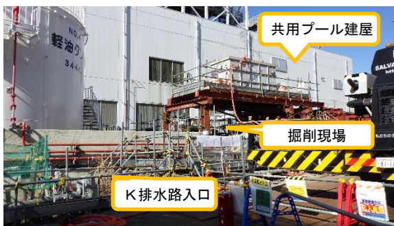
(写真1) 掘削現場付近の状況