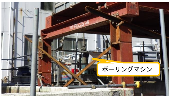
(写真2-1) ボーリングマシンの設置状況① (南東側から撮影)