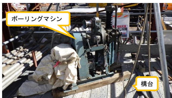
(写真 2 - 2) ボーリングマシンの設置状況② (構台上、西側から撮影)