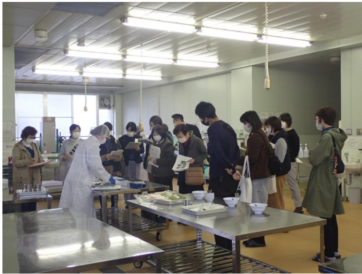
↑ PH メーターと糖度計の紹介

A. 様々な業務を経験できることが魅力です。研修、実習、会議を通して研修受講者、農産物加工者、学生、関係機関職員など様々な方と関わることができます。自分の成長を実感しながら業務に取り組むことができます。