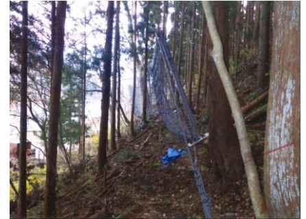
高エネルギー吸収型 落石防止柵工

令和2年度は、ロープネット工等の整備を進めました。令和3年度は引き続き工事を進め、工区完了を目指します。