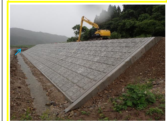
← 護岸施工状況 (令和3年6月末時点)