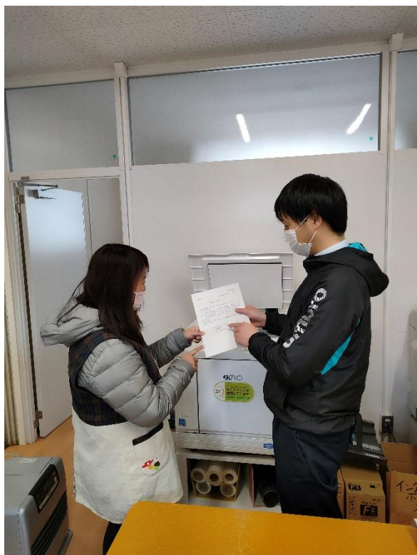
↑ スクール・サポート・スタッフへ印刷依頼及び内容の相互確認

A. 明るく元気な対応を心がけています。学校には緊張した様子で電話を架けてくる保護者の方や、普段行くことのない事務室に不安そうに訪れる子どもがいます。そういった緊張や不安を少しでも解消できるよう、努めています。