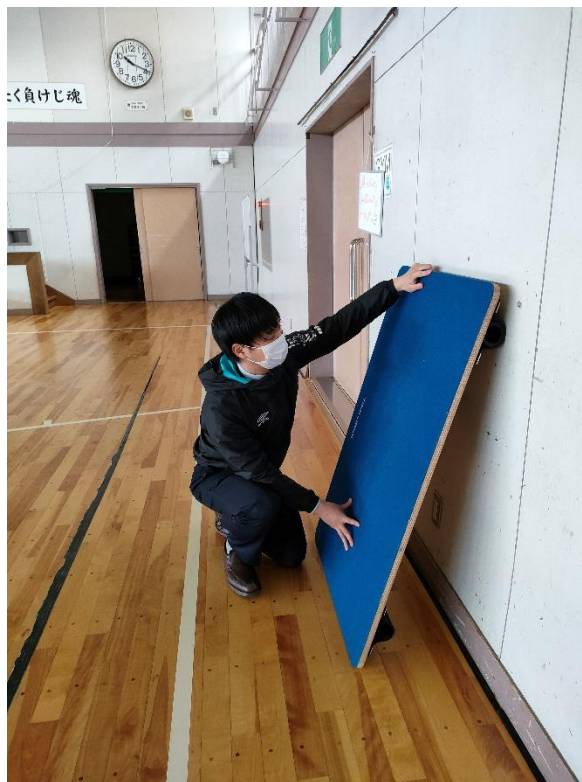
↑ 購入した教材備品の確認