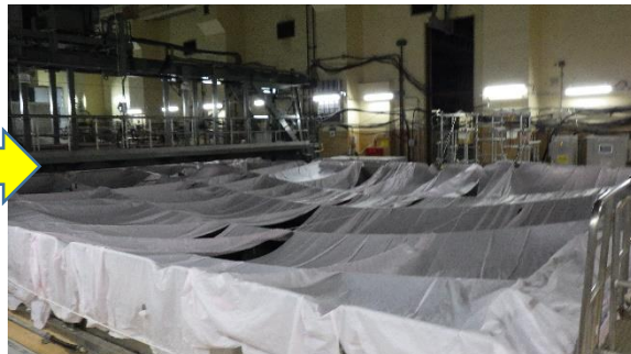
(写真1-2) 同左 (令和3年6月15日撮影)