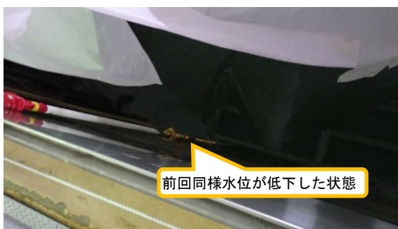
(写真3) 貯蔵プールの状況