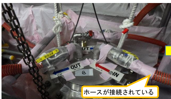
(写真2-1) 浄化フィルタ設置の状況 (令和3年3月16日撮影)