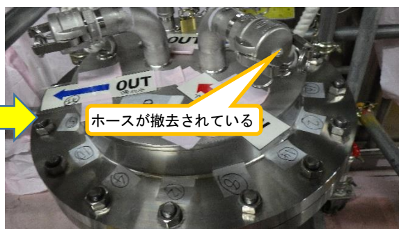
(写真2-2) 同左 (令和3年6月15日撮影)