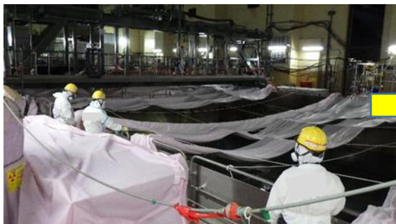
(写真1-1) サイトバンカ建屋2階貯蔵プールの 状況 (令和3年3月16日撮影)