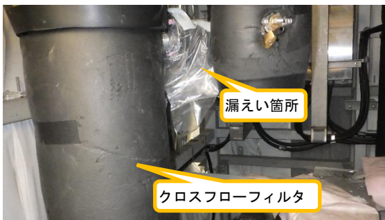
(写真1-2) 漏えい発生箇所周囲の状況② (遮へい材内)