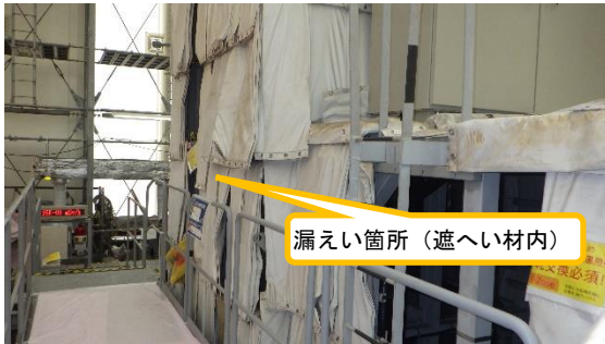
(写真1-1) 漏えい発生箇所周囲の状況① (漏えい箇所は遮へい材内)