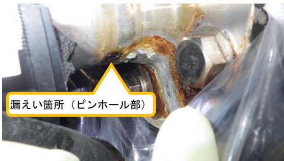
(写真1-3) 漏えい発生箇所の状況