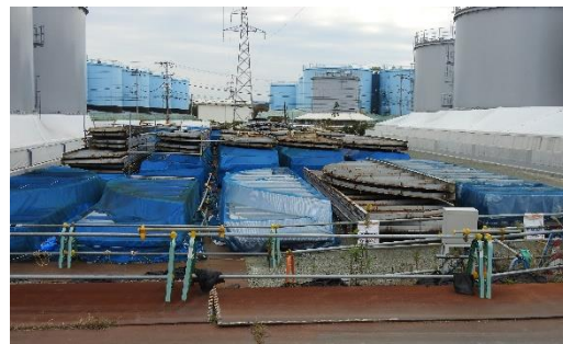
(写真2-2) 屋外一時保管場所(天蓋) (エリア北側から撮影)