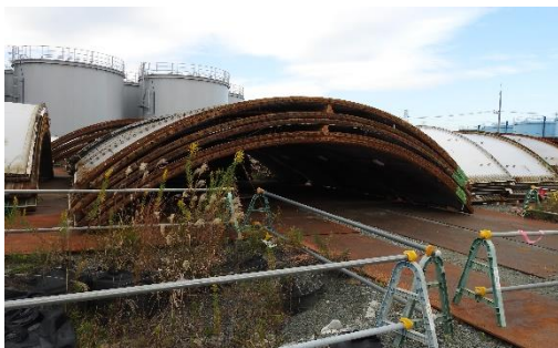
(写真2-1) 屋外一時保管場所(側板) (エリア東側から撮影)