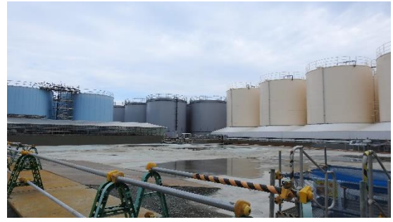
(写真1-2) G4北タンクエリアの状況 今回撮影 南西側から撮影