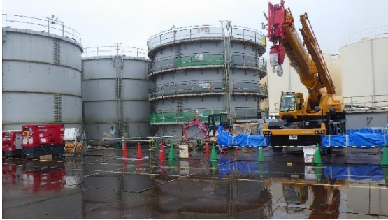
(写真1-1) G4北タンクエリアの状況 前回(令和2年7月6日)撮影 南西側から撮影