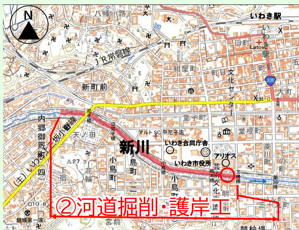
写真 新川の災害復旧や河道掘削等の工事状況について代表的な箇所を掲載しています。