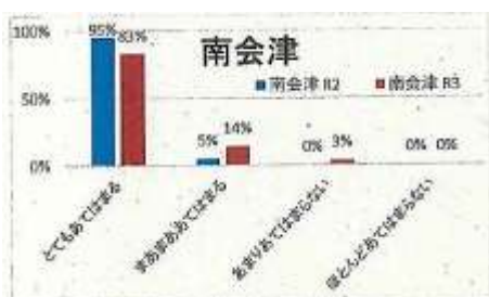
【児童:子ども教室は楽しいですか】