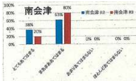
【スタッフ:仕事に満足していますか】