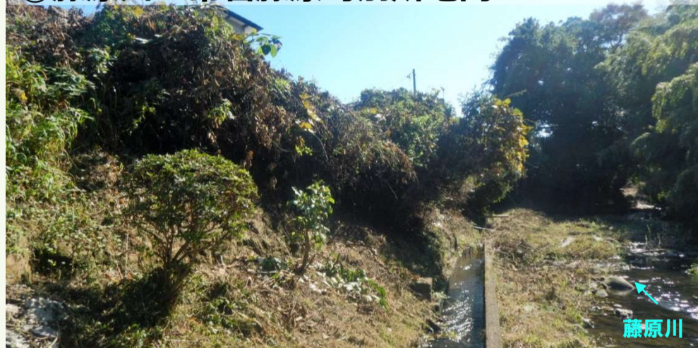
①藤原川 常磐藤原町別所地内 【施工前】