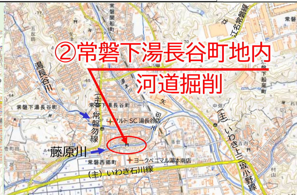
写真 藤原川で実施している工事の代表的な箇所を掲載しています。