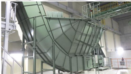
(写真5) ホッパと廃棄物コンベヤ