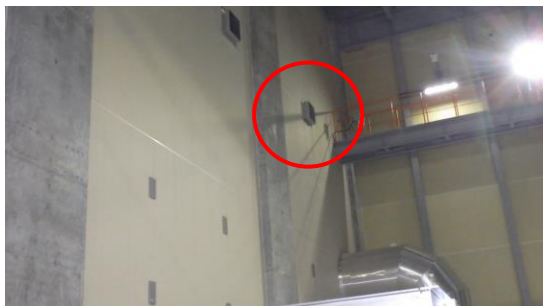
(写真1) 修理した耐火ボードの状況(1) (赤丸部分)