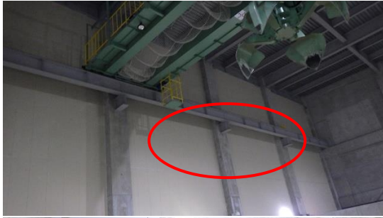
(写真2) 修理した耐火ボードの状況(2) (赤丸部分) (廃棄物貯留ピットの上部)