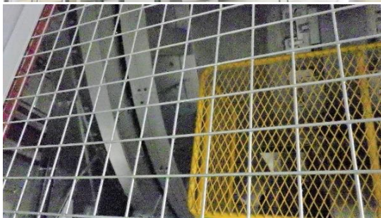
(写真6) ロータリーキルン