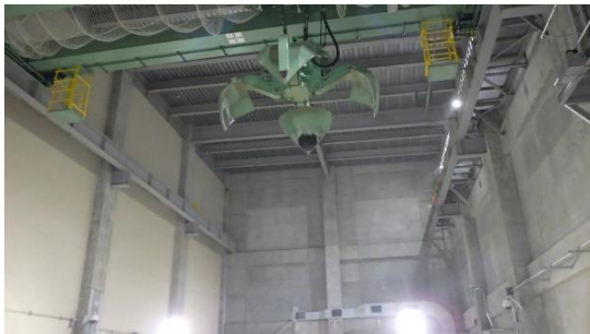
(写真4) 廃棄物クレーン 廃棄物貯留ピットの上部にあり、 ピット内部の廃棄物をコンベヤに運ぶ。