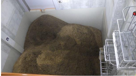
(写真3) 廃棄物貯留ピットの状況 チップ化した伐採木が貯留されている。