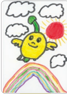
たいよう にじ 太陽と虹の いろ 色づかいがすてき！