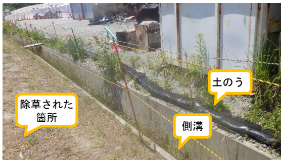
(写真1) 一時保管エリアPの側溝付近の状況 (北東側から撮影)