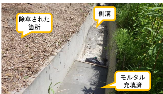
(写真2) 一時保管エリアPの北側の側溝付近 の状況(西側から撮影)