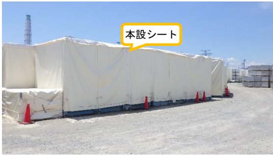
(写真3) 一時保管エリアPで保管されている 収納容器の例