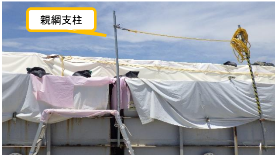
(写真4-3) ノッチタンク上部の状況