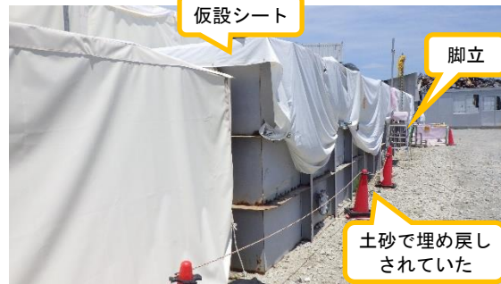
(写真4-2) 同左 (令和4年6月30日撮影)