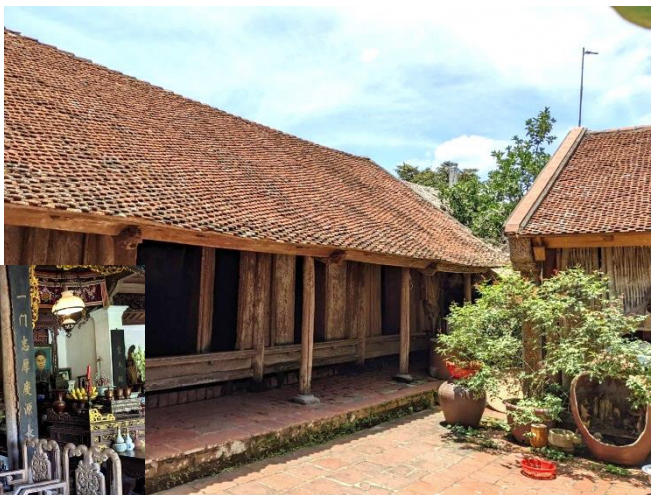
▲乾燥レンガの伝統家屋