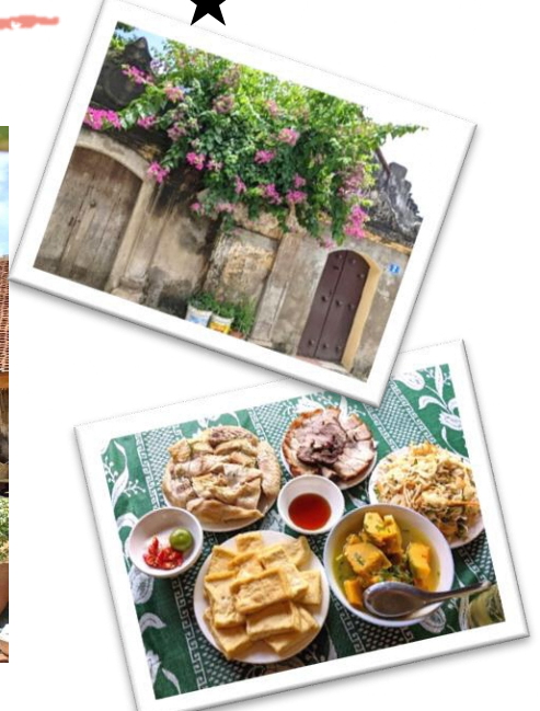
▲おいしい村のご飯ごちそうになりました!

ハノイの中心地から約50km離れたところに位置するドンラム村 (Làng cổ Đường Lâm) に海外協力隊の隊員と遊びに行ってきました。長い歴史が息づくドンラム村。この村には5つの集落が集まっていて国家文化財になっている伝統家屋がたくさんあります。