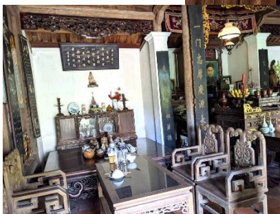
▲伝統家屋の中の様子