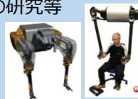
遠隔操作ロボット