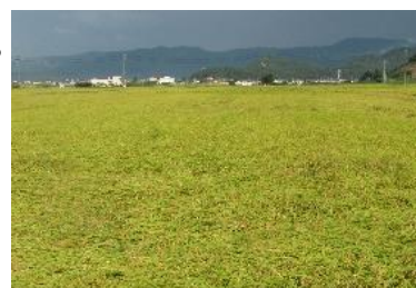
図3 水稲の倒伏ほ場