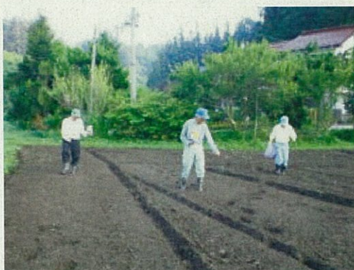
種をまいてみました

(国道399号を飯舘村飯樋町から浪江町津島方面へ車で) ○問い合わせ：飯舘村産業振興課まで