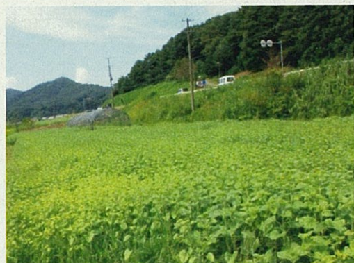
開花するのをまつばかり