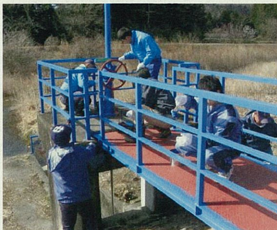
ゲートの防食塗装作業