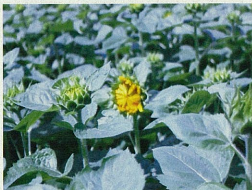
二枚橋のひまわり