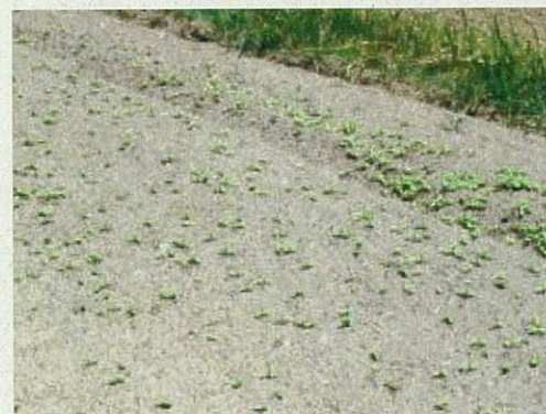
すくすく育ってます (8月8日現在)

事務局：福島県農地・水・環境保全向上対策地域協議会相双支部 (福島県相双農林事務所農村整備部農村環境整備課内) TEL：0244-26-1167 FAX：0244-26-1168