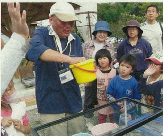
生きもの観察会① (子供たちも真剣)