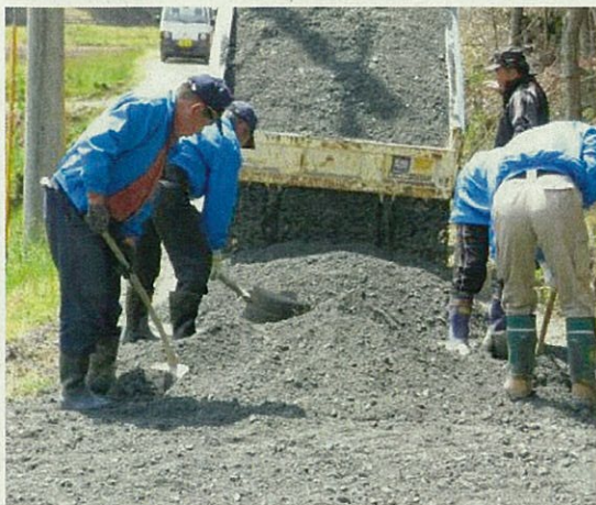
農道の敷き砂利作業