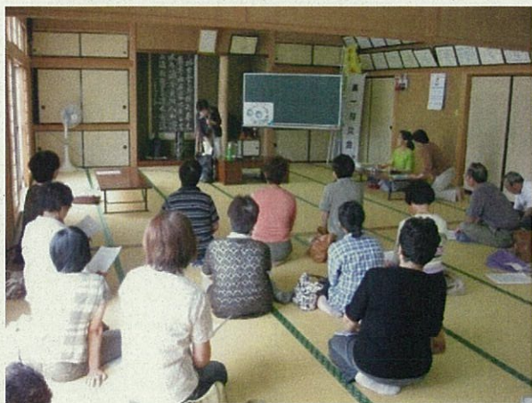
水質と生態系に関する出前講座 (女性の会を中心に受講した)