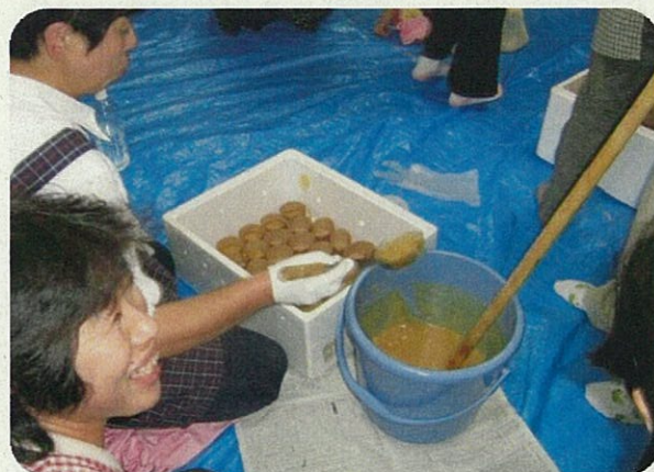
水質保全に配慮したEM石鹸づくり