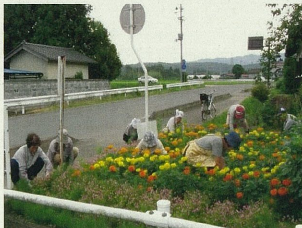
花壇の手入れ作業 (通学路)