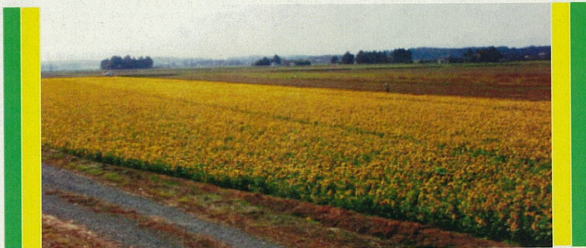
「晩秋のひまわり畑」渋佐地域資源保全隊(南相馬市)