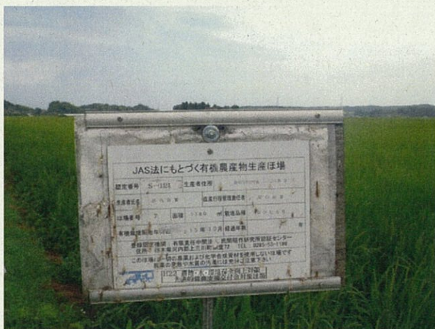
有機農産物生産ほ場 (水稲)