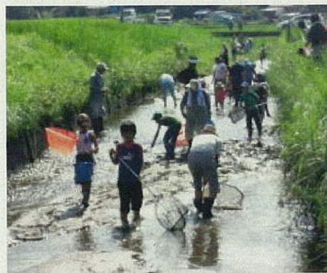
水路の生きもの調査