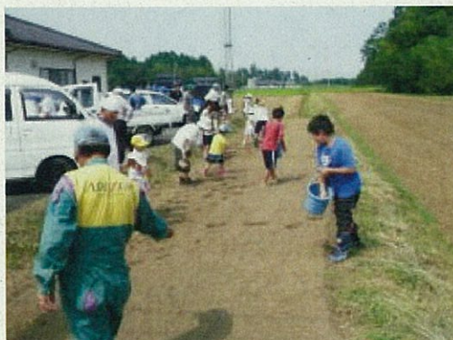
楽しく種をまきました