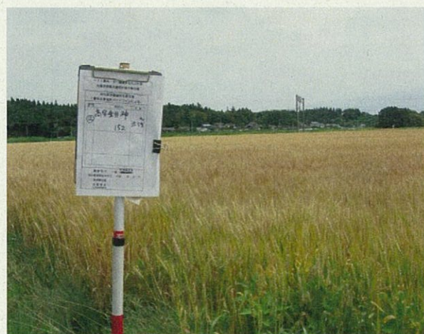
特別栽培ほ場 (小麦: きぬあずま)