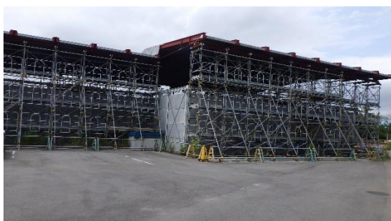
(写真1) H2タンクエリアブルータンク設置 箇所の外観