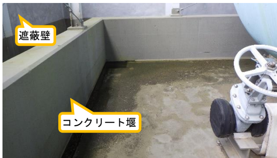
(写真 2 - 2) 遮蔽壁内の状況