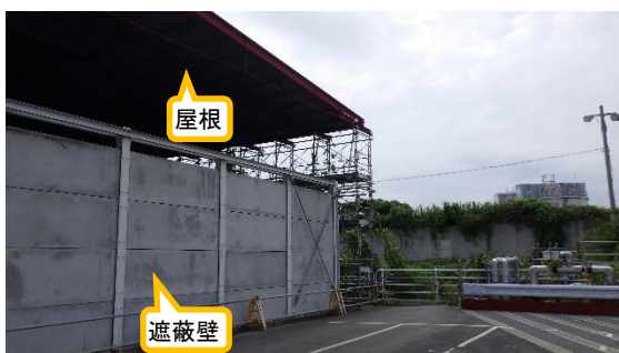
(写真2-1) 遮蔽壁の周囲の状況