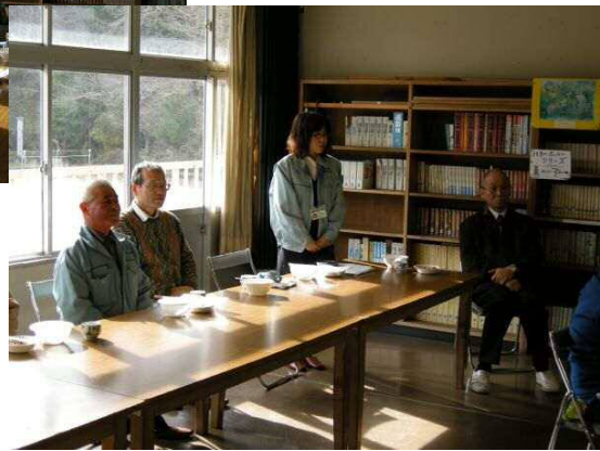
J Aあぶくま石川 のお話です。