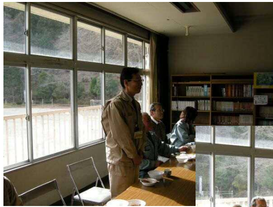
お世話になった 県中農林事務所