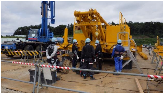
(写真2) 地盤改良用重機の調整状況