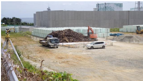
(写真3) 廃棄物集積の状況