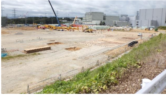
(写真1) A棟建設予定値の状況