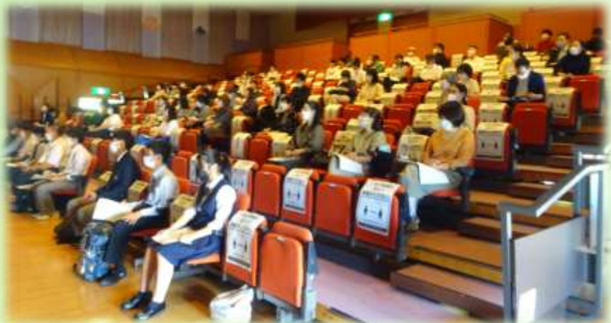
【多くの方にご観戦いただきました。ありがとうございました。】