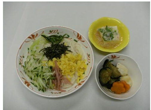
【病院のそうめんメニュー】