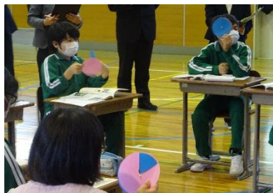
<心情円を見比べて>

重点内容項目に特化した「道徳の別業」 田島第二小学校では、児童の実態や教師・家庭・地域の願いから重点内容項目を「親切・思いやり」に定め、各教育活動と道徳科の学習との関連やねらいを明確にし、全教職員が同じ視点をもって子供たちを育てていくことができるような「道徳の別業」を作成しています。