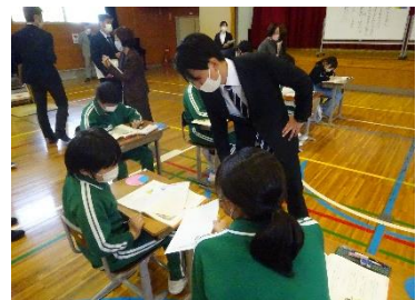
<友達との違いを感じて>