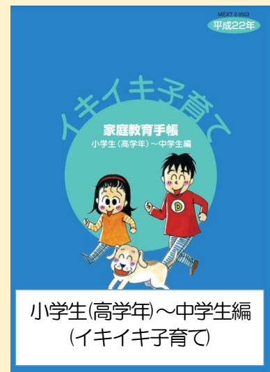
小学生(高学年)～中学生編 (イキイキ子育て)