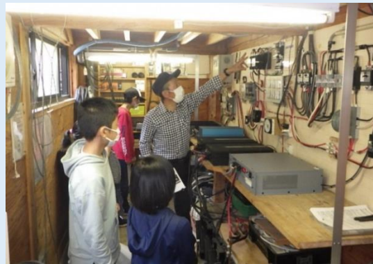
だいこん村の施設を用いた実物に触れられる体験教室