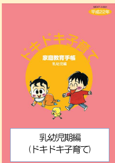
乳幼児期編 (ドキドキ子育て)

しかしながら、近年の都市化や核家族化、少子化、地域における地縁的なつながりの希薄化など、家庭や家族を取り巻く社会状況は大きく変化しています。そのため、文部科学省では、すべての親が安心して子育てや家庭教育を行うことができるよう、様々な取組や情報提供を行っています。今回紹介する「家庭教育手帳」には家庭での教育やしつけに関して、子育てのヒントになることが書かれています。文部科学省のホームページや下記二次元コードから見るすることができますので、ぜひご活用ください。