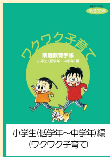
小学生(低学年～中学年)編 (ワクワク子育て)