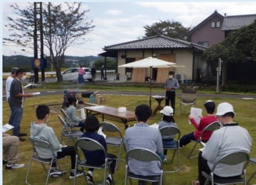
自然エネルギーと環境問題を通した環境学習を開催