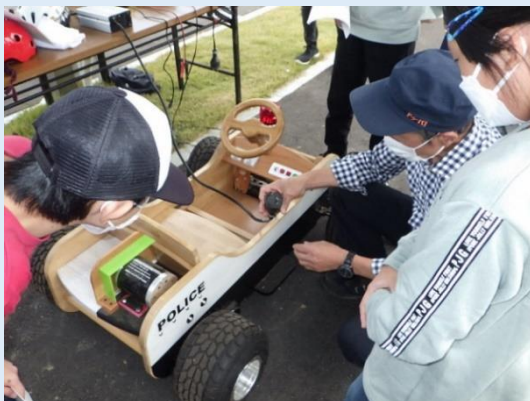
手作り電気自動車の試乗体験を通したCO 2 削減や自然エネルギーを体験