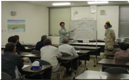
真野川 説明会状況

県民の皆様におかれましては、説明会等について開催案内がありましたら、是非参加いただき、復旧・復興の推進に向けて、ご協力のほどよろしくお願いいたします。