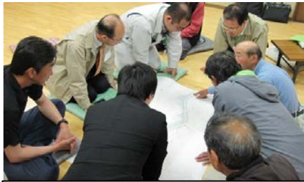
日下石川 説明会状況