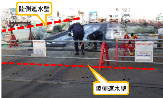
(写真 2-2) 4号機原子炉建屋西側エリアのアスファルト舗装の状況② (南側から撮影)