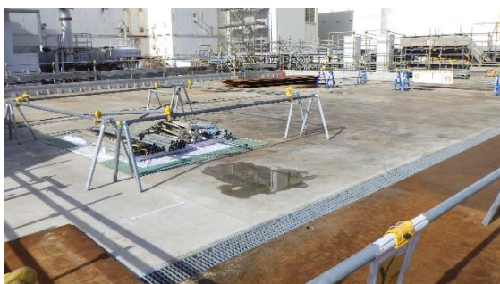
(写真 3-2) 550t クレーン撤去跡のフェーシングの状況 (南東側から撮影)