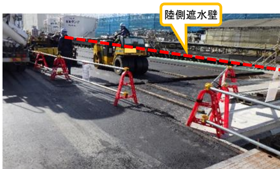
(写真 2-1) 4号機原子炉建屋西側エリアのアスファルト舗装の状況① (北東側から撮影)