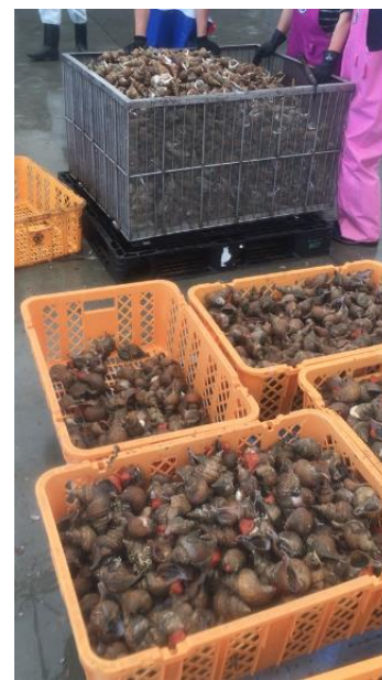
奥：シライトマキバイ 手前：エゾボラモドキ