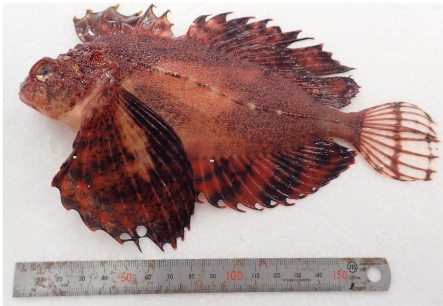
図1 漁業者から提供されたホカケアナハゼ