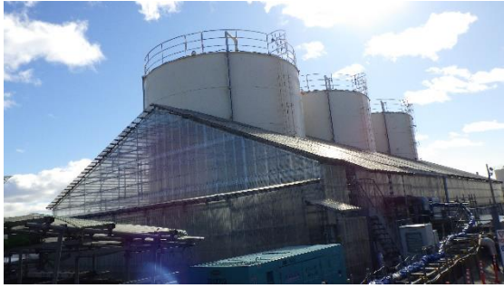
(写真1) サブドレン集水タンク外観 (南西側から撮影、手前からNo. 1、 No. 2、No. 3)