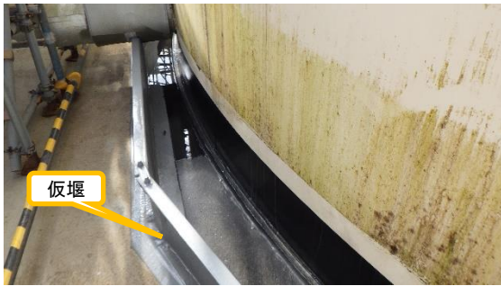
(写真2) サブドレン集水タンクNo. 1の仮堰 の状況