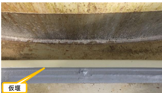
(写真4) サブドレン集水タンクNo. 3の仮堰 の状況