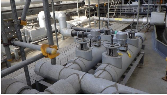
(写真5) サブドレン集水タンク堰内の各種配 管の一例