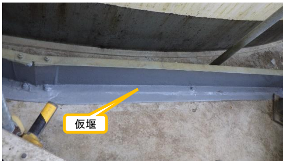
(写真3) サブドレン集水タンクNo. 2の仮堰 の状況