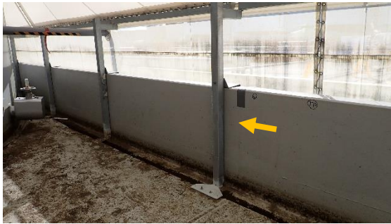
(写真2-2) H6 (II) タンクエリアにおける修復済みの雨水カバー支柱の状況 (黄矢印)