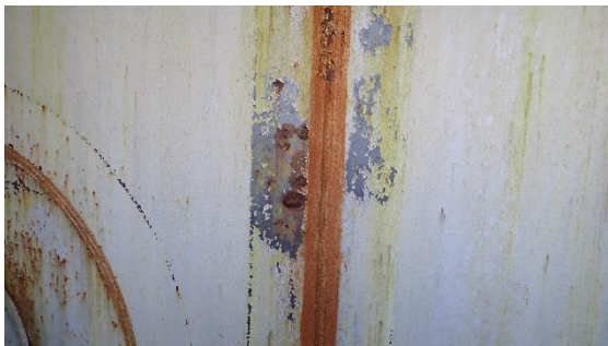
(写真1-3) J8タンクエリア タンク表面の発 錆の状況