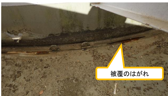
(写真1-4) J8タンクエリア タンク底部にお ける被覆のはがれ