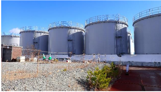
(写真2-1) H6 (II) タンクエリア外観