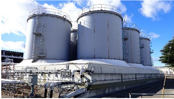
(写真1-1) J8タンクエリアの外観