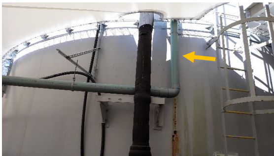
(写真1-2) J8タンクエリアにおける修復済みの 雨樋配管の状況 (黄矢印)