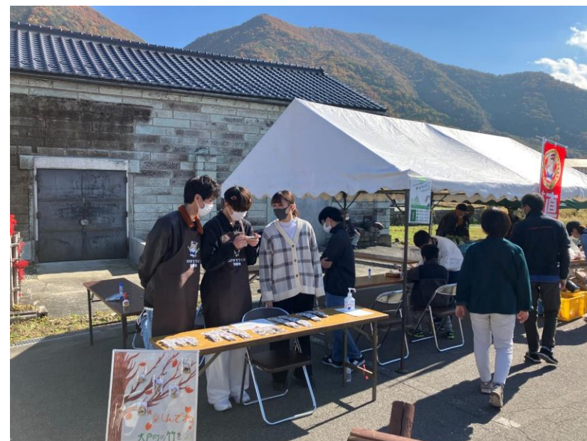
大戸マルシェ当日の様子