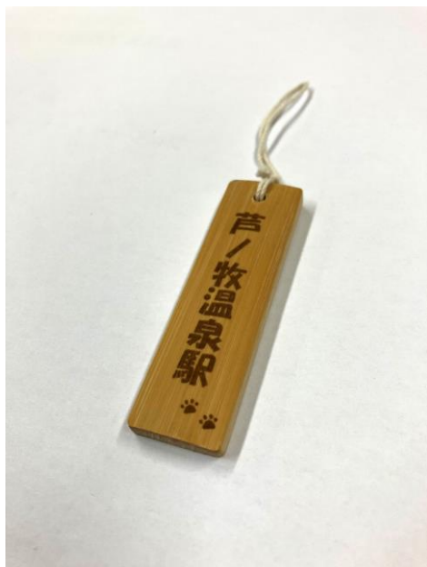
(景品) デザインした竹ストラップ