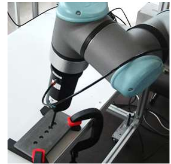
協働ロボットによるバリ取り

人とのコラボレーション作業が可能な協働ロボットです。協働ロボットの導入効果を事前に検証できます。ロボットプログラムの作成など社内の人材育成にも活用できます。協働ロボットはロボット開発の世界標準となっているミドルウェア「ROS」による制御も可能です。 ※ROS：ロボットオペレーションシステムの略