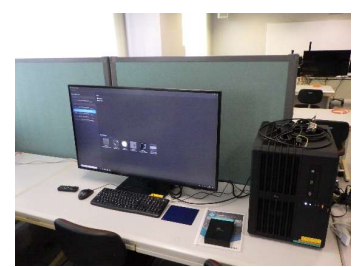
AI・IoT開発支援システム (4,830円/時間)