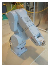
6軸垂直多関節ロボット (1,150円/時間)