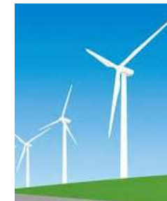
風力発電設備リサイクル