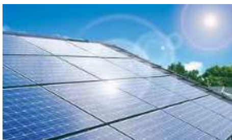
太陽光パネルリサイクル