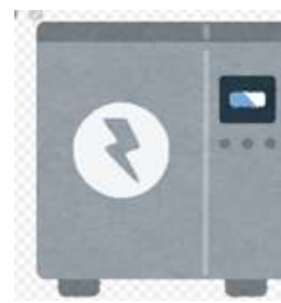
二次電池リサイクル