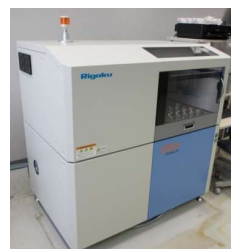
波長分散型蛍光X線分析装置 (3,950円/時間)