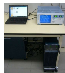
高調波・フリッカ測定器 (1,580円/時間)