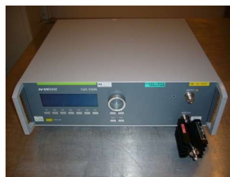
伝導電磁界イミュニティ シミュレータ (2,220円/時間)