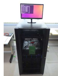
共有AIプラットフォーム (7,160円/時間)