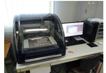
AI・IoT開発支援システム (4,830円/時間)