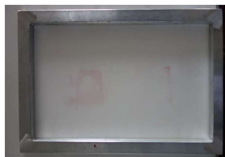
スクリーンと専用枠