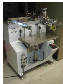
孔版式平面・曲面印刷機 (940円/時間)