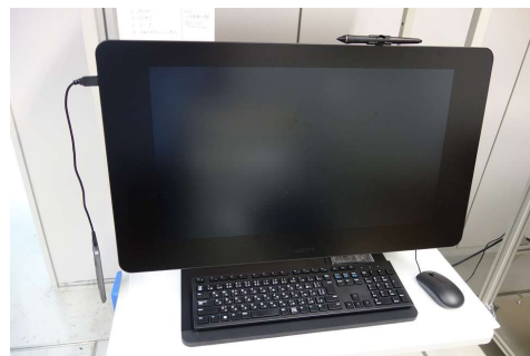
多色刷り色用分版ソフト付属の液晶タブレット