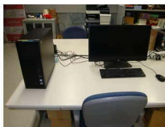
デザイン支援機器 (810円/時間)