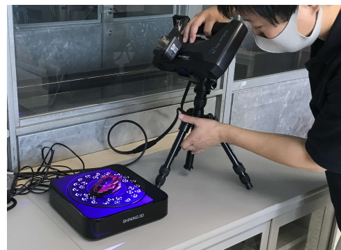
セッティングの様子