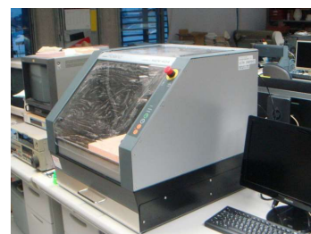
卓上型NC加工機 (860円/時間)