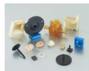
<観察2> 左：自動車部品、右：プラスチック部品