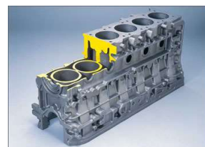
<観察1> 左：繊維品及び繊維材料、右：鋳造品