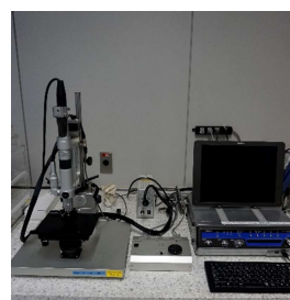
マイクロスコープ (1,440円/時間)