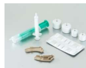
<観察3> 左：電機・電子部品、右：医療部品