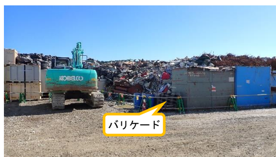
(写真2-3) 仮設集積場所の南側の状況 (中央部から撮影)