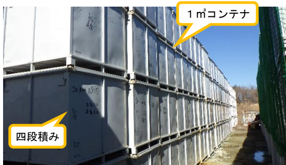
(写真2-1) 仮設集積場所の中央部の状況 (中央部から撮影)