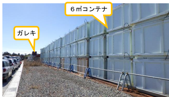
(写真2-2) 仮設集積場所の東側の状況 (北側から撮影)