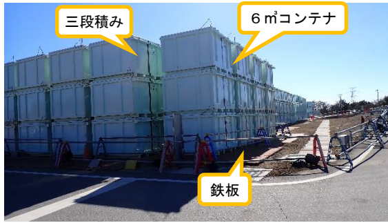
(写真1) 仮設集積場所の西側の状況 (北西側から撮影)