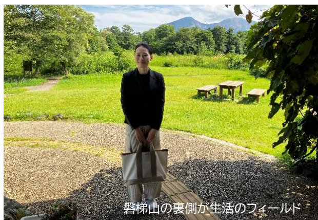
磐梯山の裏側が生活のフィールド

裏磐梯は他の地域から移り住んできた人が多いという土地柄もあると思うのですが、よく言われるよ