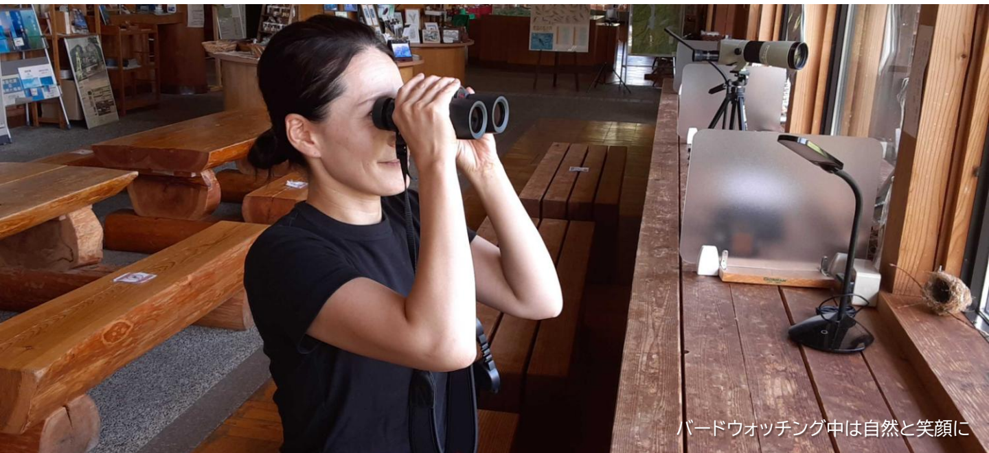
バードウォッチング中は自然と笑顔に

回覧板を回すという習慣が残っています。 うちは隣が2キロ離れているのでちょっと手間です。