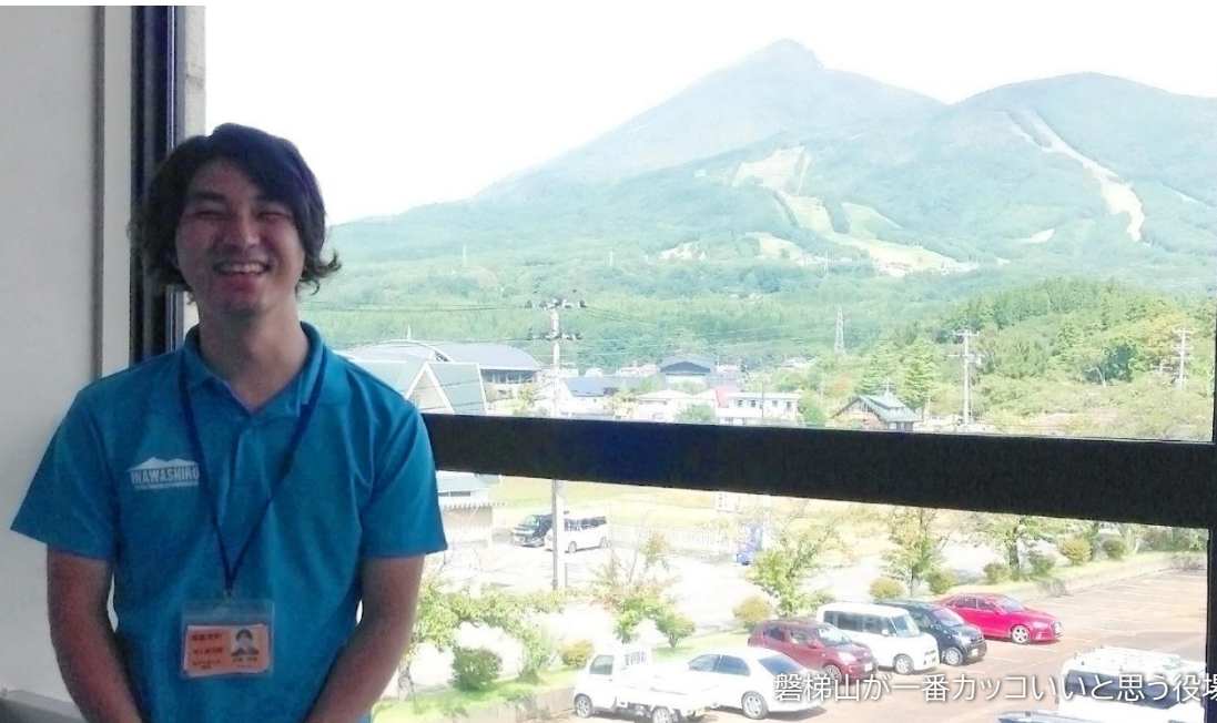
磐梯山が一番カッコいいと思う役場の三階から

まずは猪苗代町にぜひ来てみてください。そして、猪苗代を実際に感じてください。私がサポートします！