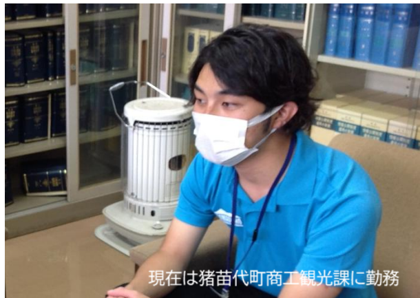
現在は猪苗代町商工観光課に勤務

雪道の運転も4年ほど裏磐梯で過ごしたので心配はありませんし、雪片付けも嫌いではないです。猪苗