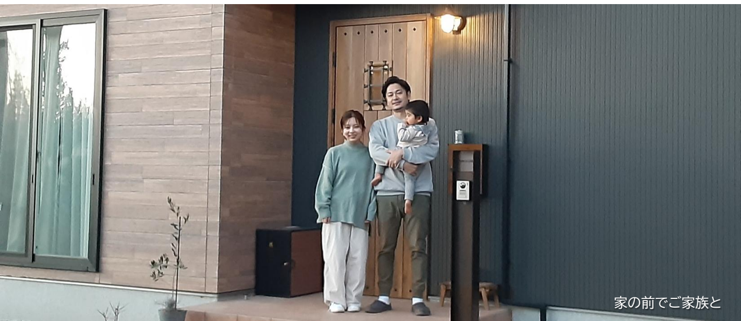
家の前でご家族と