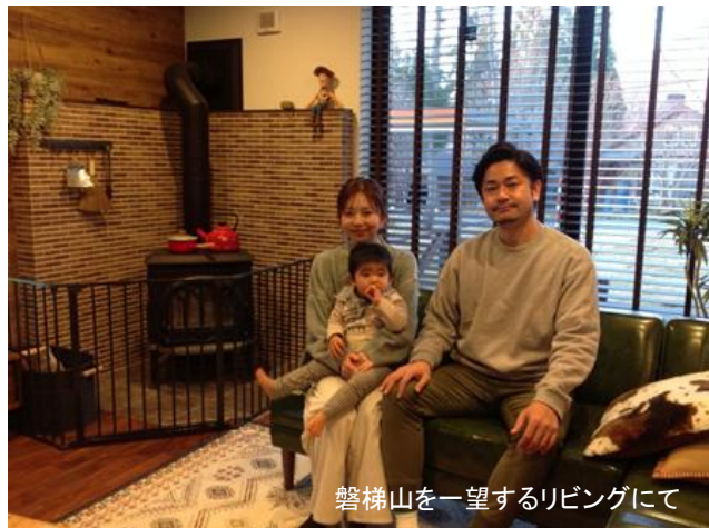
磐梯山を一望するリビングにて

私は人生も仕事も後悔しないようにしたいと常に思っています。まだ全力でいきたいですね。