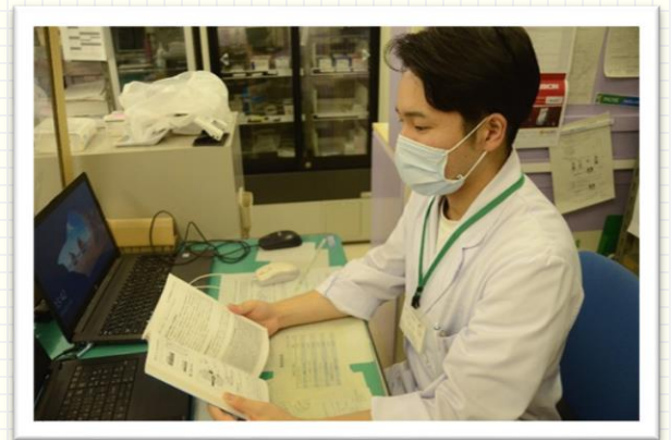
↑時間があれば専門書を読んで勉強！

入庁前後のギャップとして感じたことは職場内での雰囲気が良いことです。というのも、はじめは公務員ということでお堅い印象を持っていました。しかし、今ではそうは思いません。色々な人がいて、仕事上での悩みについても気軽に話すことができ、和気あいあいとした職場で、想像していたよりも働きやすいと感じています。