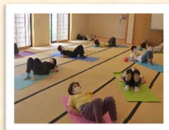
〔にこにこ体カアップ講座〕