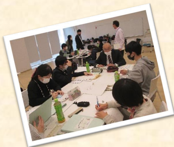
〔ジャーナリストスクール開催事業〕