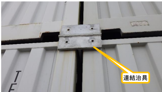
(写真2-1) エリアAAのコンテナに設置されている連結治具の設置状況