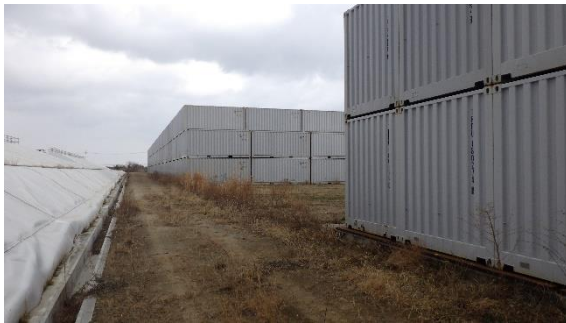
(写真1-2) エリアAAの状況（南西側から撮影）