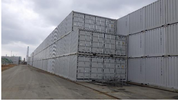
(写真1-1) エリアAAの状況（北東側から撮影）