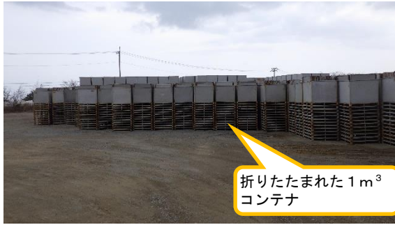
(写真3-2) エリア i の状況②