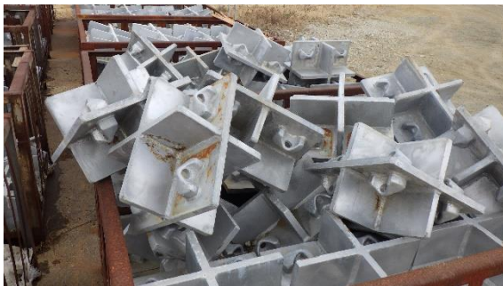
(写真2-2) 現場に保管されていた連結治具