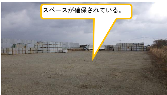
(写真3-1) エリアiの状況①