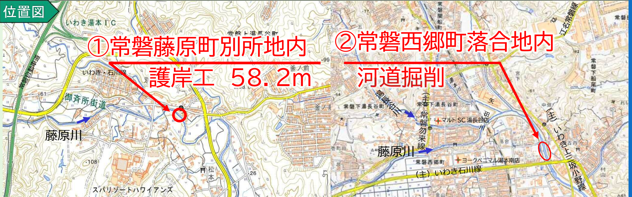
写真 藤原川の災害復旧や河道掘削等の工事状況について代表的な箇所を掲載しています。