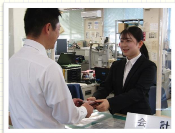
↑財布を持ち主へ返還

初めて行ったことや気づいたことはメモをとったり、疑問点は上司に質問して解消したりして覚えています。また、メモを元に自分の「まとめノート」を作成し、後で見返せるようにしています。私の行っている遺失拾得物業務は、県民の方々の権利に関わる身近で大切な業務であるため、確実にこなせるように日々取り組んでいます。