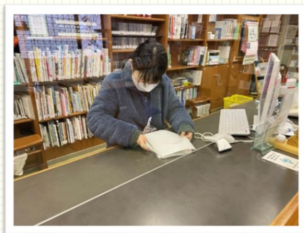
↑雑誌にカバー（フィルムコート）をかける作業

分からないことがあると、皆さんと一緒に考え解決してくれるのでとても質問がしやすいのびのびと仕事ができます。また、とても話しやすく、ほかのチームの方も気にかけてくださるので、仕事に対する責任感とやる気が芽生えてきます。