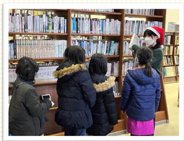
↑クリスマスイベントで子どもたちを案内

たくさんの人に本を読んでもらい、県民の皆さんが新しい視野や世界に出会えるようにお手伝いをできたらいいと思っています。本には、たくさんの知識や発見が詰まっています。本と人々を繋げることで、皆さんの暮らしをより豊かにすることができれば良いです。